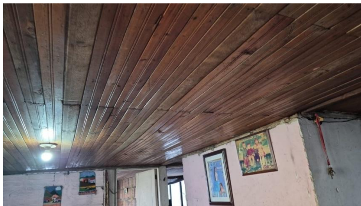
Figura 8. La actividad de instalación de cielo raso, se realizará en las áreas de sala de estar y habitaciones.