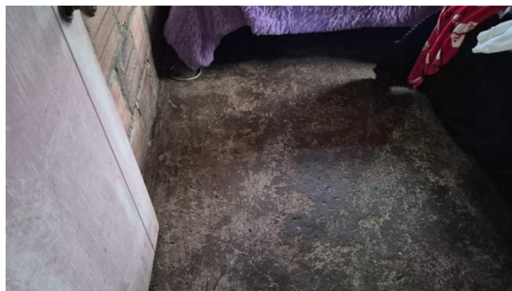
Figuras 5, 6 y 7. Área de las habitaciones en donde se implementarán las acciones de enchape.