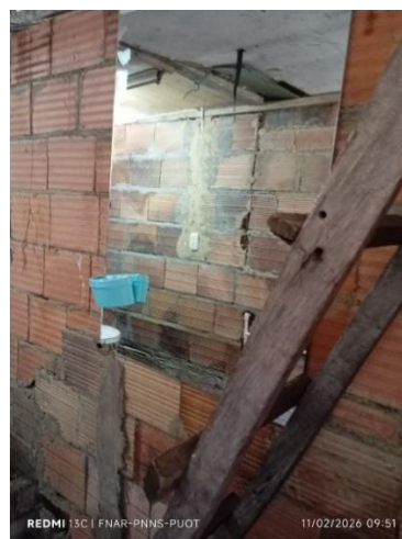
Figuras 1 y 2. Área del Sanitario y Zona Húmeda a Intervenir.