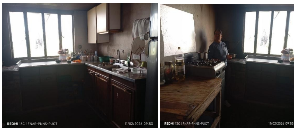
Figuras 3 y 4. Área de la cocina a intervenir (en esta área es donde se implementarán las acciones de Mampostería para Muro Divisorio Bloque Estriado No. 4 y construcción del Mesón en Concreto).